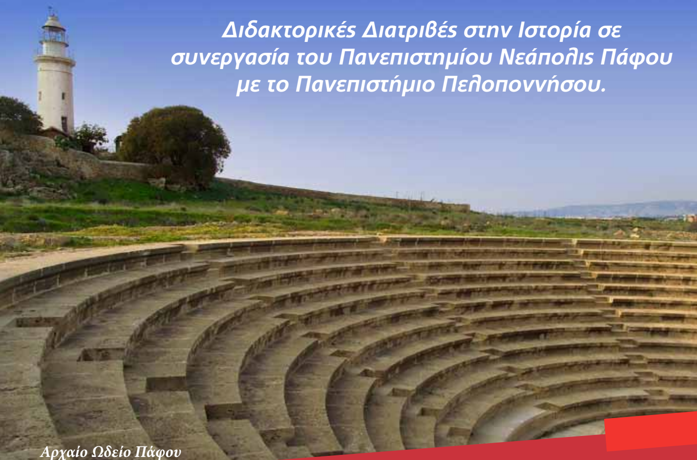
Αρχαίο Ωδείο Πάφου

Διδακτορικές Διατριβές στην Ιστορία σε συνεργασία του Πανεπιστημίου Νεάπολης Πάφου με το Πανεπιστήμιο Πελοποννήσου.