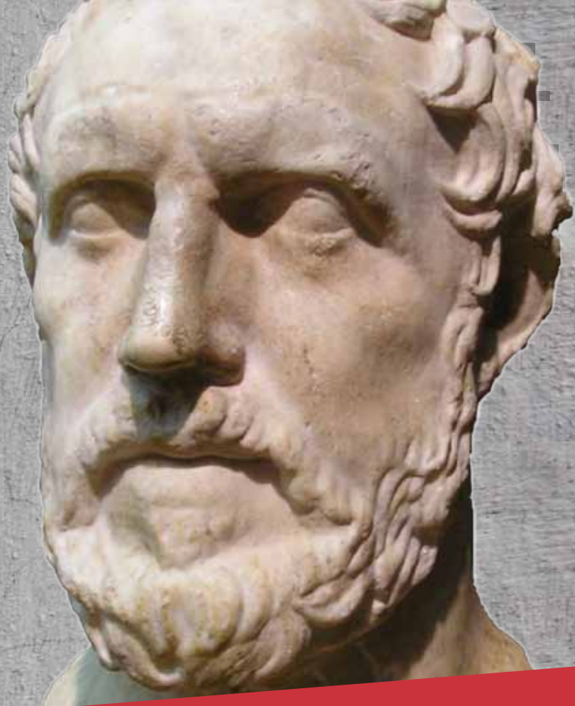
Θουκυδίδης (5ος αι. π.Χ.)

Διδακτορικές Διατριβές στην Ιστορία σε συνεργασία του Πανεπιστημίου Νεάπολης Πάφου με το Πανεπιστήμιο Πελοποννήσου.