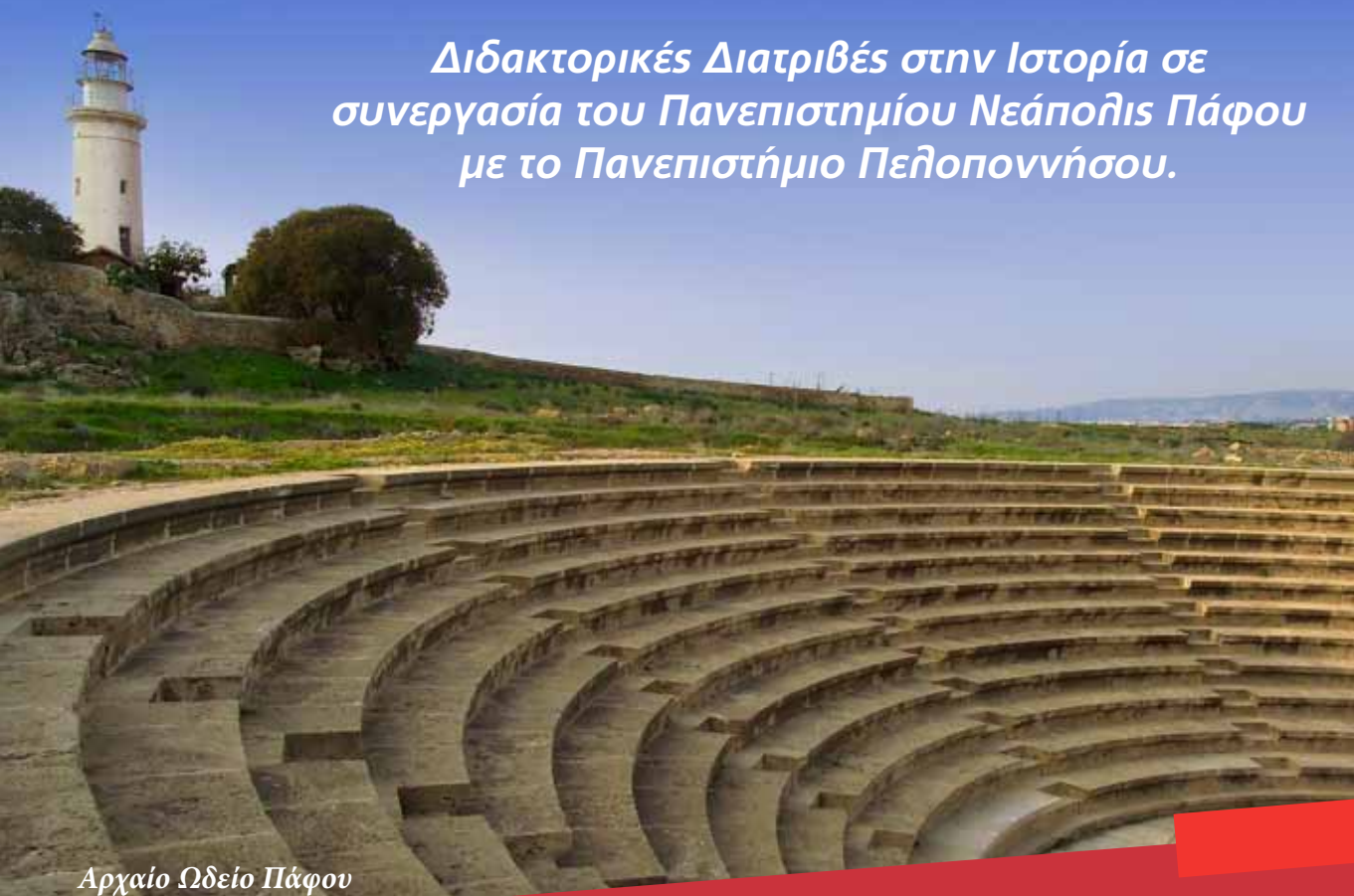
Αρχαίο Ωδείο Πάφου

Διδακτορικές Διατριβές στην Ιστορία σε συνεργασία του Πανεπιστημίου Νεάπολης Πάφου με το Πανεπιστήμιο Πελοποννήσου.