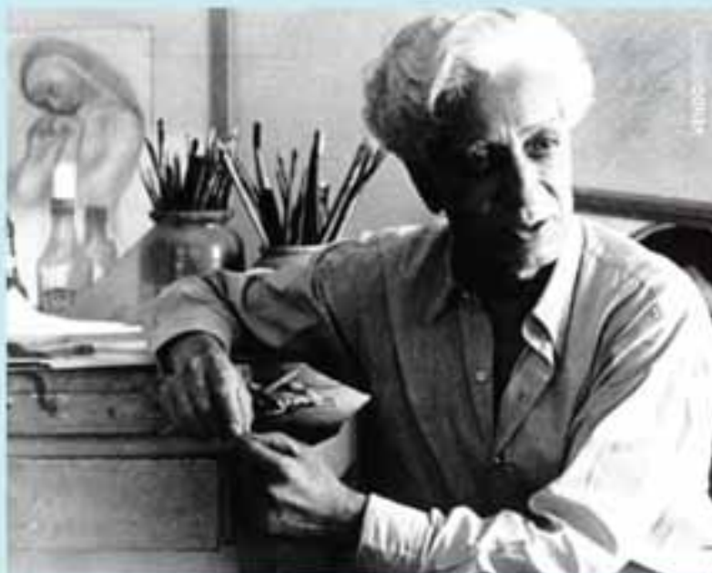
Ο ζωγράφος Αδαμάντιος Διαμαντής (1900-1994)