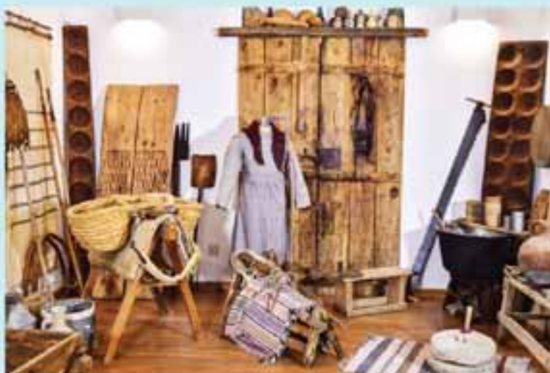
Από το εσωτερικό του Μουσείου Αγροτικής Ζωής